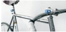
Tänt var det här!

● Vintagetrenden gäller även cyklar. Den sköna 70-talsracern – eller ännu hellre fixien som du sätter ihop själv – smäller liksom högre än den sprillans nya i bubbelplast. Problemet med de där gamla och hemmasnickrade hjornarna är att de tenderar att sakna små detaljer. Som lysen till exempel.